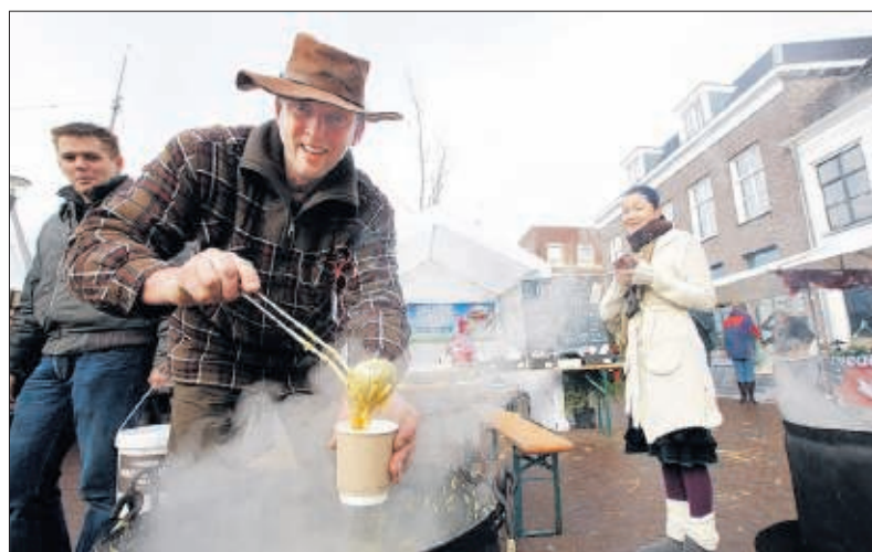
In 2011 was er in Amersfoort een speciale streekmarkt.

Is Amersfoort stiekem aardappelstad in plaats van keistad?